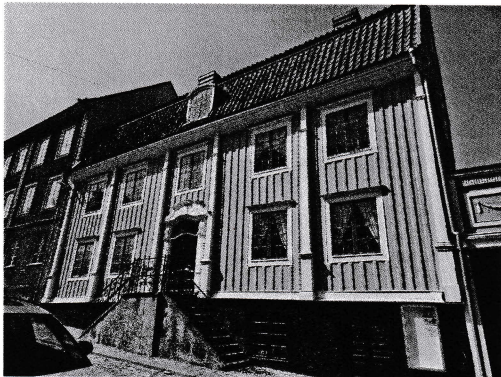
Lars Olsson Smith föddes i Kiaby i