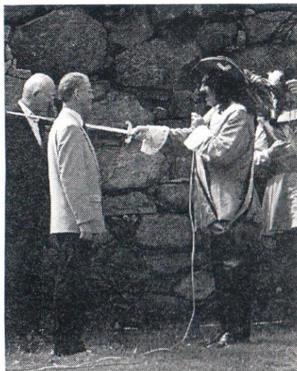
Konung Karl X Gustaf, väldigt lik en känd Karlshamnskännare, dubbar en ny kommendant.