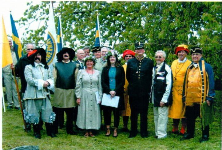
Karl X Gustav, Erik Dahlberg och kommandanter med de nya Castellaterna.