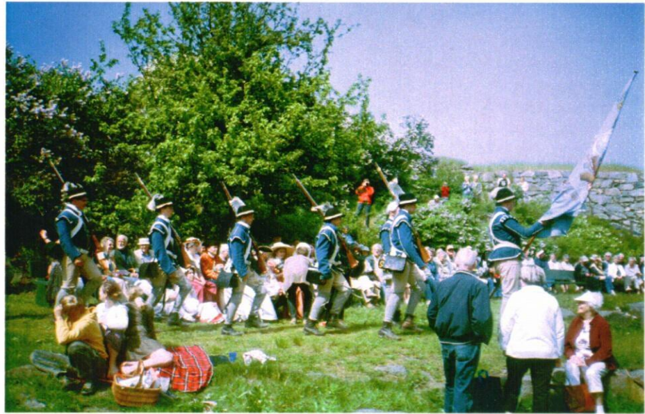
Karlshamns stadsborgargarde rycker fram.