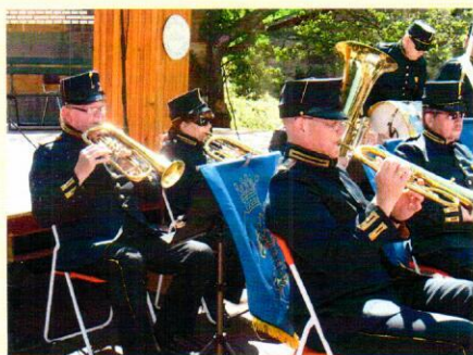
Blåsande bataljon med blänkande bleck från Blekinge.

Kastelletts Dag blev en blåsig historia men med god uppslutning och i övrigt soligt väder. Blekinge Bataljons musikkår var tillbaka efter ett års frånvaro, vilket återställde ordningen. Tre recipiender dubbdades in i Sällskapet som medlemmar nr. 172, 173 och 174.