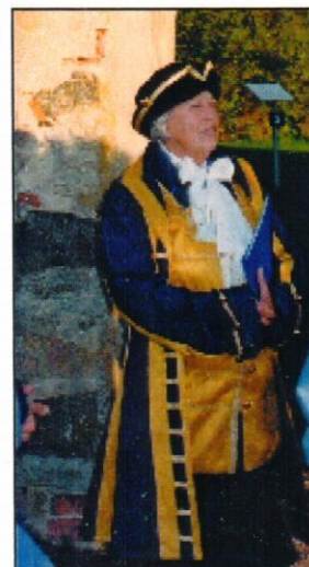
Kommandanten berättar om Castellet