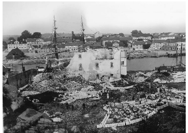
Efter branden 1892

År 1955 uppmanade stadsfullmäktige i Karlshamn hamndirektionen att köpa byggnaden. 1963 revs Stickan för att lämna plats för byggandet av margarinfabriken som invigdes 1965.