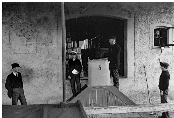
Lagerbyggnaden 1910 efter om- och tillbyggnaden.