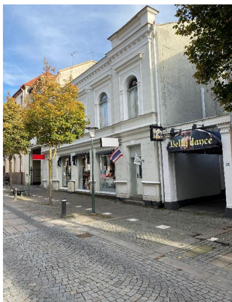
Den Frykmanska gården idag.