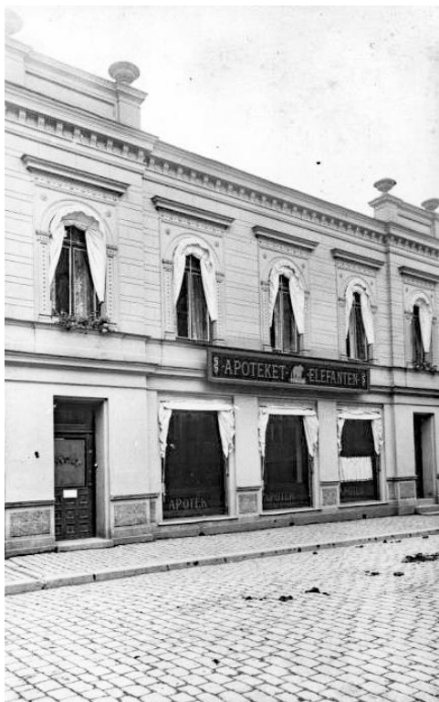
Apoteket Elefanten i början av 1920-talet.